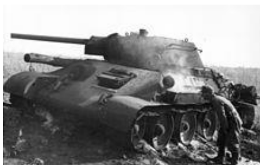
Немецкий солдат разглядывает подбитый советский танк Т-34, июнь 1943 года

Боевые действия начала в составе 6-го механизированного корпуса. 9 января 1943 г. 11-я гвардейская механизированная бригада преобразована из 54-й механизированной бригады, а 79-й отд. танковый полк 54-й мехбригады преобразован в 54-й гв. танковый полк.